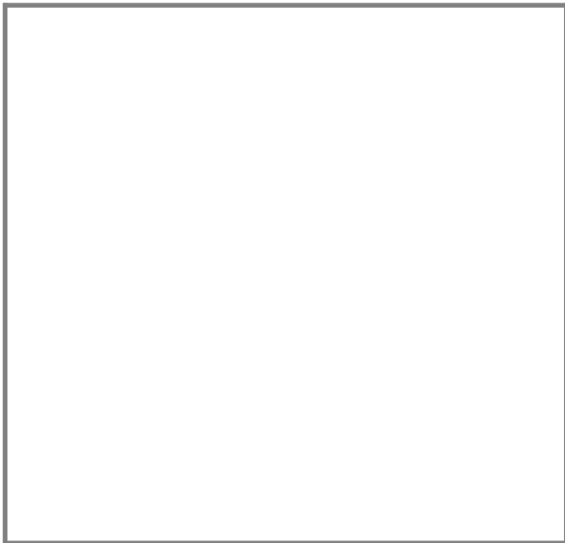
热转印涂层 白杯批发 陶瓷马克杯 广告杯定制 diy定制logo 个性定

买机器赠送：杯子夹具送三个、真空吸盘上皮、欧标电源线、教学光盘、密封条、普通皮管、耐高温手套、中英文说明书、印杯子模板烫画图库、高温胶带一卷、进口升华张一包100张。