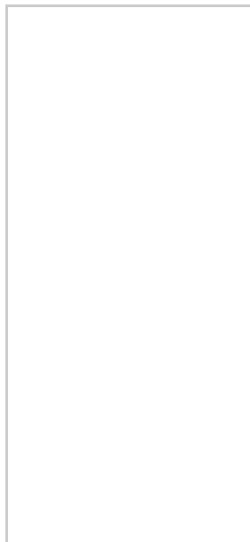
608型抢答器4英寸主屏背面