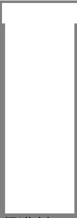
促进剂d 抢购价 ¥ 元